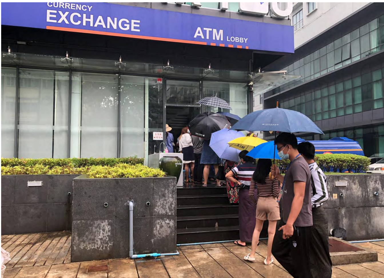
2021年4月，仰光排队取款机。

抢劫银行分行的情况一直在增加 38 并且在途现金也成为攻击目标。 39 缅甸中央银行是唯一为其行业发布安全指南的行业监管机构。2015年3月9日的14/2015号指令向银行提供有关闭路电视、警报系统和在途现金的指令。关于在途现金，陈述说：