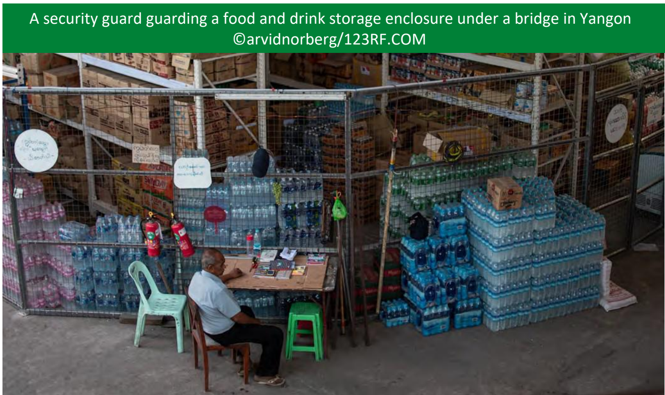
A security guard guarding a food and drink storage enclosure under a bridge in Yangon

为了明确界定本次评估的范围，它使用了《私人安全服务提供者国际行为准则》（ICoC）中的定义。这将“安全服务”定义为“保护和保护个人和物体，如车队、设施、指定地点、财产或其他地方（无论武装或武装）”。它还借鉴了新加坡立法中的定义 1 以及根据国际行为准则来定义“保安公司”、“保安官”和“保镖”（见方框2）。