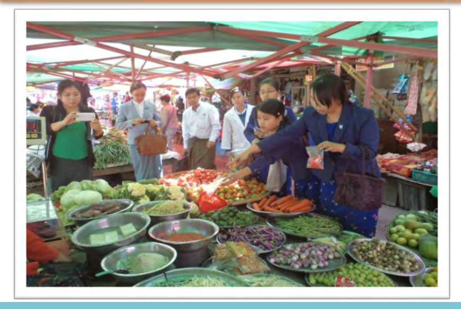
Department of Food and Drug Administration