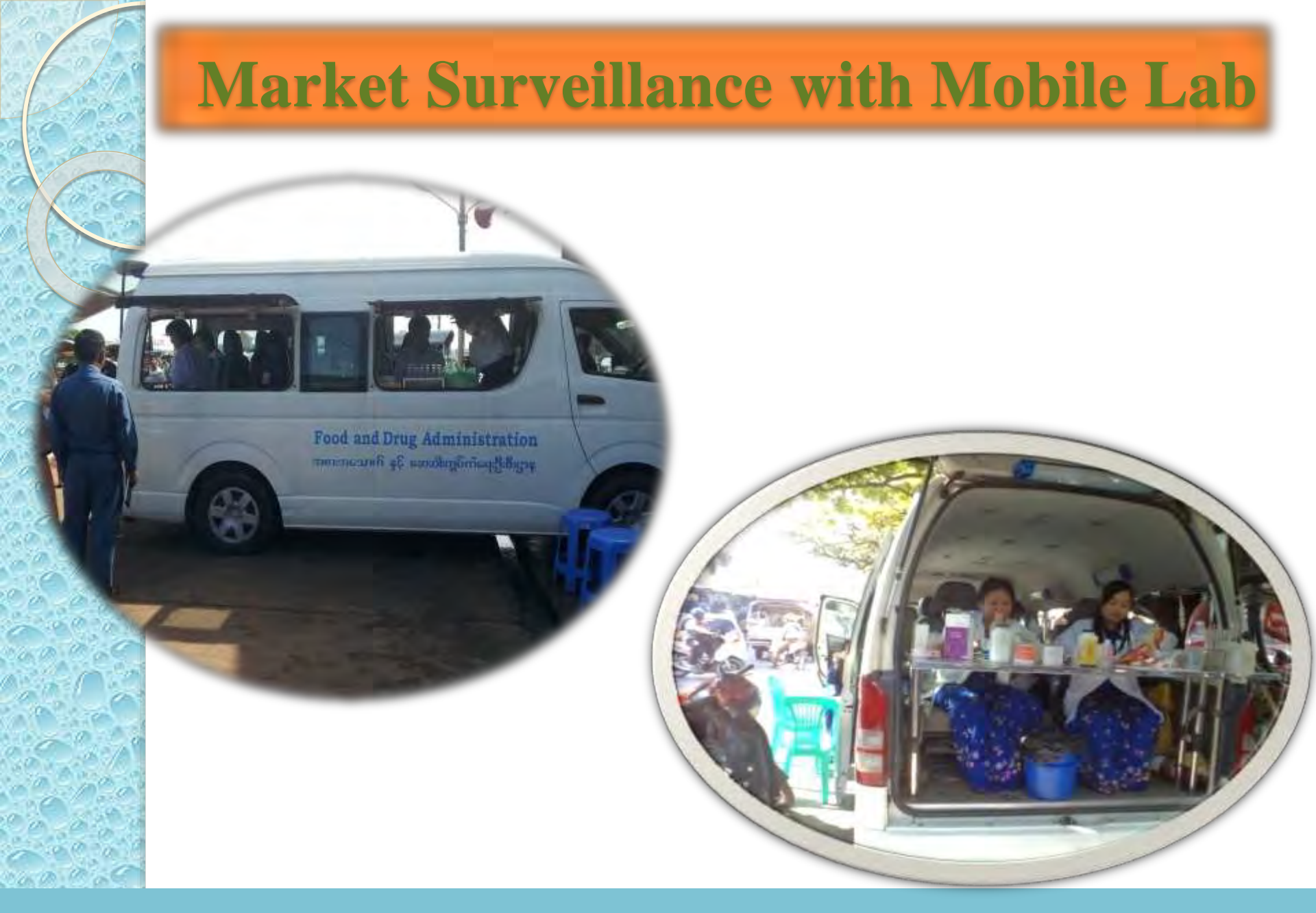
Department of Food and Drug Administration