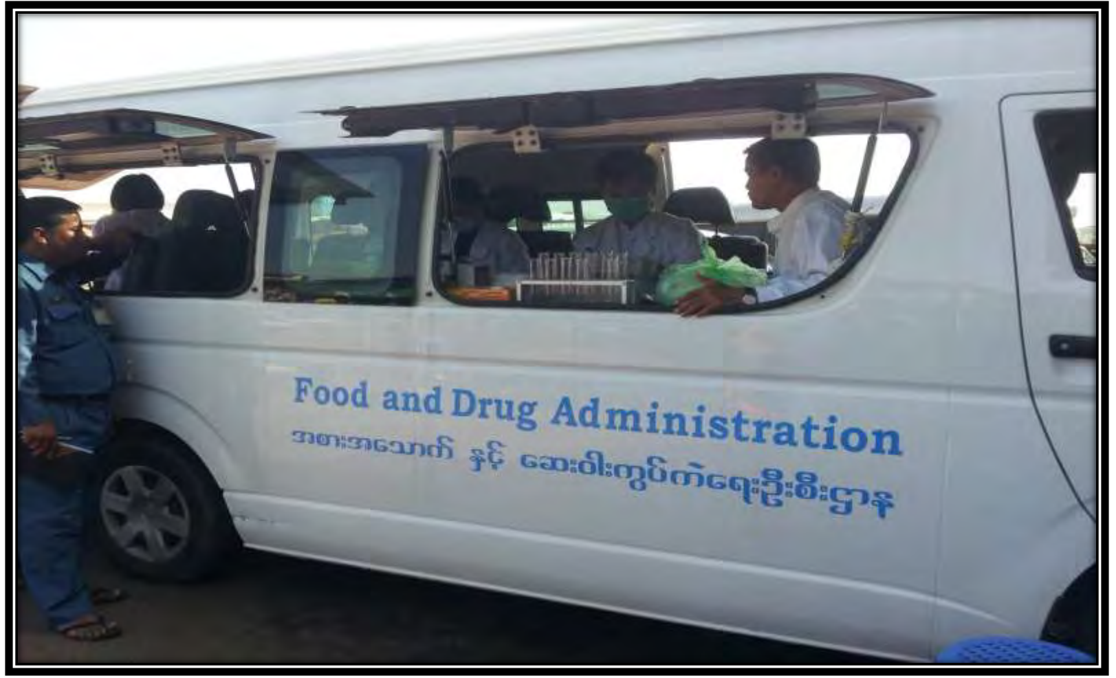
Department of Food and Drug Administration