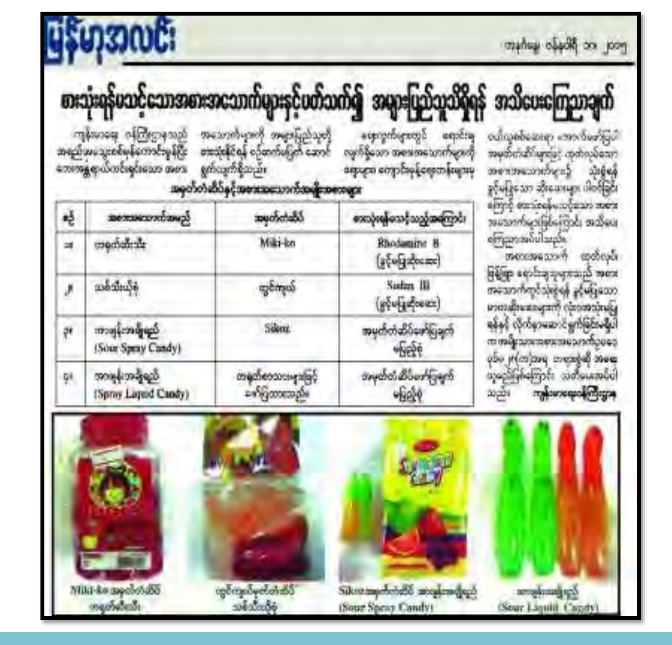
Department of Food and Drug Administration